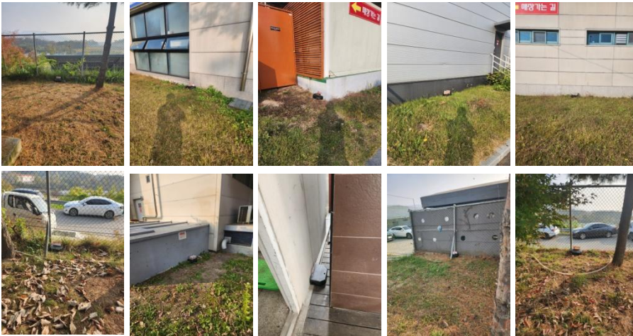
R트랩, M트랩 (10개소) 설치