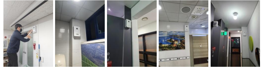
방향제 자동분사기 (24개소) 설치