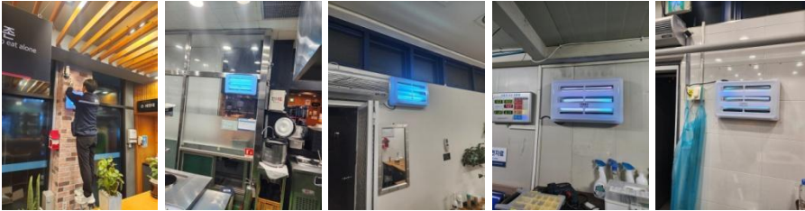
포충등 (6개소) 설치